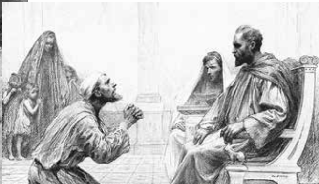
Эжен Бернанд. Притча о немилосердном должнике.

Почему Петр задал вопрос о прощении в такой форме — «до семи ли раз?» Вероятно, он видел в числе семь, выражающем божественную полноту, и меру прощения. Как бы то ни было, апостол Петр знал, что в Ветхом Завете по закону Моисееву полагалось причинить обидчику такой же ущерб, какой причинил он: «...око за око, зуб за зуб...» (Левит 24:20).