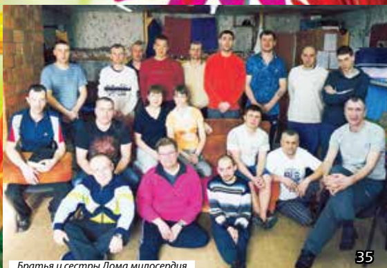
Братья и сестры Дома милосердия