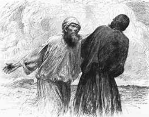
Эжен Бернанд. Притча о немилосердном должнике.

Нужно сказать, что прощать нелегко. Многие говорят, что не могут простить брату своему несправедливую обиду. Но тем не менее прощать необходимо, потому что иначе Господь не простит нам согрешений наших. Мы должны страшиться потерять дух прощения. Поспешим же скорее к Господу и попросим, чтобы Он, милосердный Господь, дал силы неустанно прощать нашим ближним. Многие из нас устали прощать, но, несмотря на это, необходимо продолжать прощать, ибо прощение есть основной принцип практического христианства.