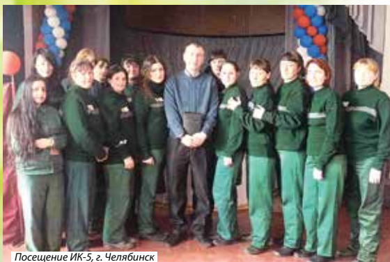
Посещение ИК-5, г. Челябинск